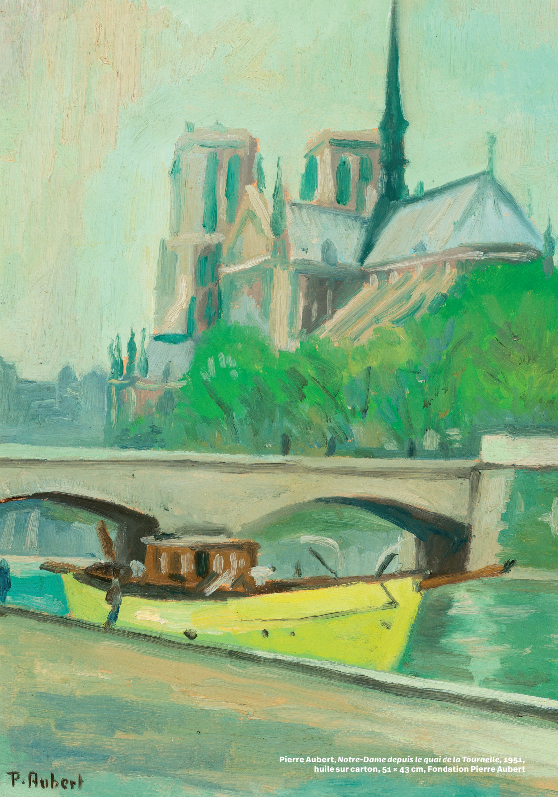
Pierre Aubert, Notre-Dame depuis le quai de la Tournelle , 1951, huile sur carton, 51 x 43 cm, Fondation Pierre Aubert